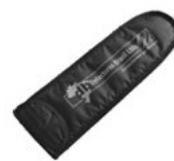
Capa para transporte