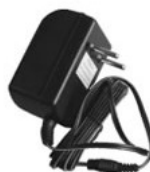
Carregador de bateria